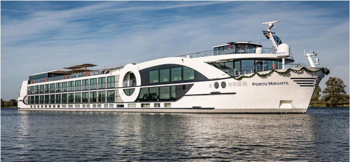
MS Porto Mirante

היא ספינה חדישה ומפוארת ביותר שתתחיל לשוט על נהר הדואורו בשנת 2024. הספינה נבנתה בעיקר עבור הקהל האמריקאי וככזו מעניקה לנופשים בה תנאים של מלון מפואר ואפשרות ליהנות ממגוון שירותים מתקדמים בעודם מפליגים במעלה ובמורד הנהר. בספינה תוכלו ליהנות ממסעדת שף, טרקלין מפואר, בר משקאות עשיר, חדר כושר, ספא ובריכה בסיפון העליון.